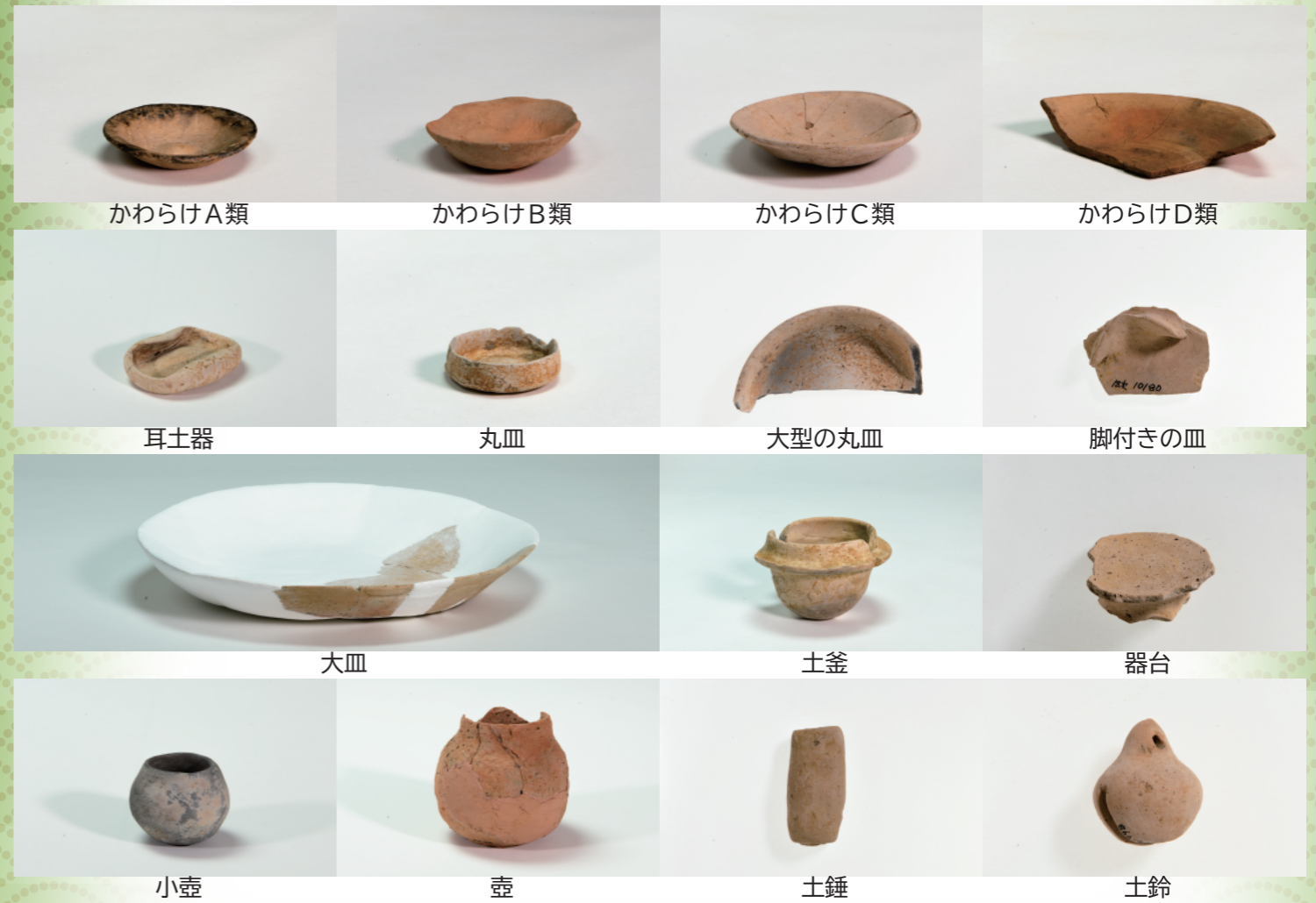
写真2 一乗谷朝倉氏遺跡でみつかるとおもな土師質土器（いずれも第18次調査出土）

トピック展「かわらけづくりの住んだ町 ～一乗谷朝倉氏遺跡瓢町の調査成果から～」展示解説