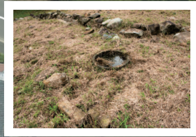
調査区南端の砂利敷道路と石組溝 左、発掘調査当時(東から撮影) 右、現在(南東から撮影)