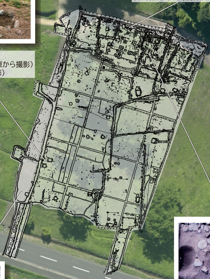
石積施設 上、発掘調査当時(東から撮影) 下、現在(南から撮影)